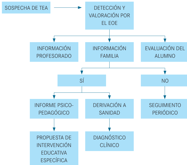
Figura 1. Algoritmo para de actuación para la detección precoz de TEA.

pedagógica, recogiendo la información de los profesionales del Centro Educativo en el que está escolarizado el alumno, de la familia y del propio alumno. En el caso de niños no escolarizados, son los Centros Base de la Gerencia de Servicios Sociales, los encargados de derivar los casos al Equipo de Atención Temprana, para que éste realice la valoración.